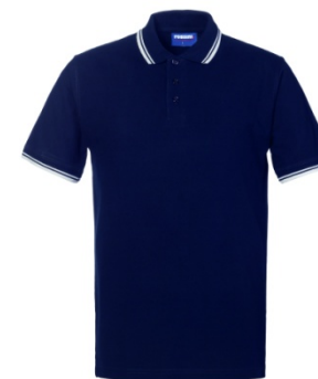
BX – BLUE/WHITE