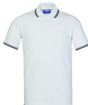
BM – WHITE/BLUE

XS, S, M, L, XL, XXL for 39 anthracite/white