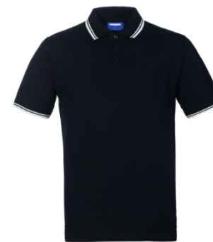
NZ – NERO/BIANCO