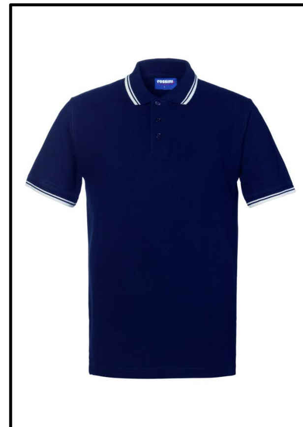
BX – BLUE/WHITE