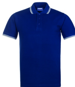
AB – ALBASTRU/ALB