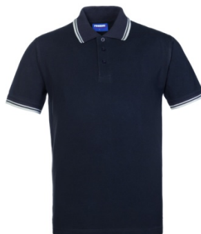
39 – ANTHRACITE/ WHITE