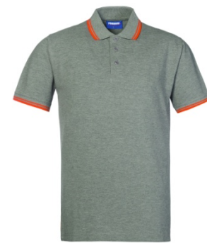
47 – GRIGIO MELANGE/ARANCIO