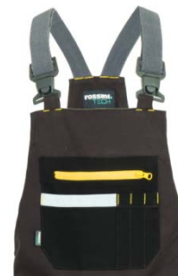
91 - WARM GREY