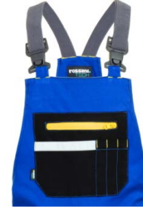
06 – AZZURRO ROYAL