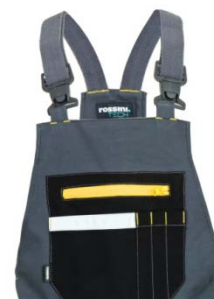
12 – GRIGIO