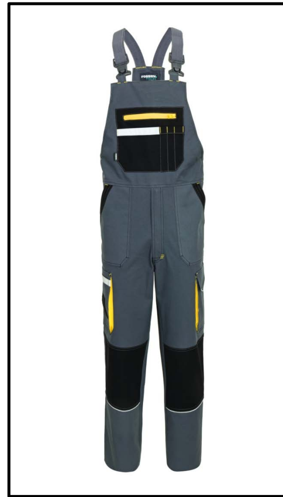
12 – GRIGIO