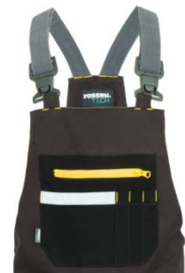
91 - GRIS CÁLIDO