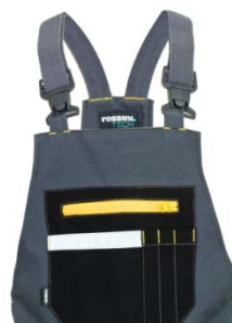
12 - GRIS