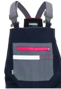
01 – BLU