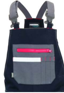
01 - BLUE