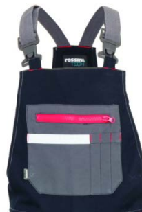
01 - BLEUMARIN