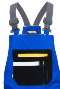
06 - AZUL REAL