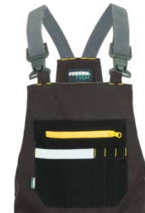
91 – WARM GREY